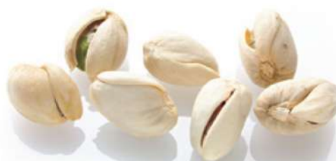
عدم تطابق لبه های پسته