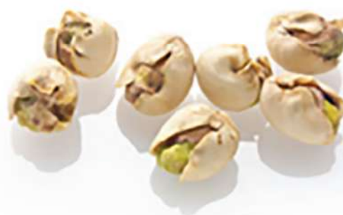
پوسته مچاله شده