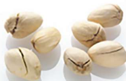
موقعیت شکاف نادرست