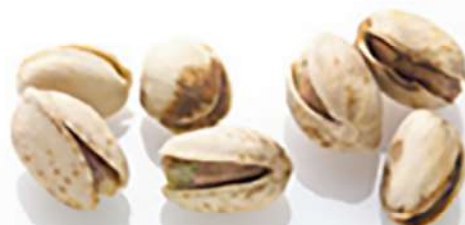
لکه های تیره