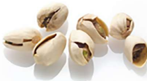
آسیب دیدگی مکانیکی