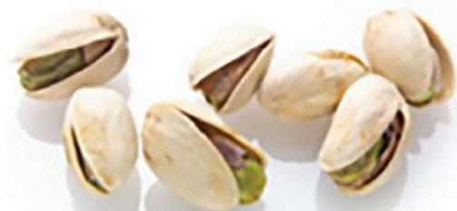
لکه های روشن