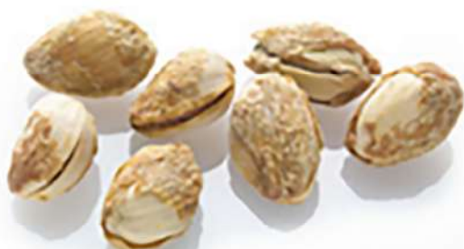
چسبندگی پوسته تازه به پوسته استخوانی