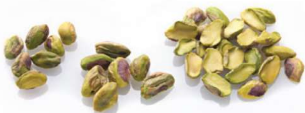
مغز پسته سالم